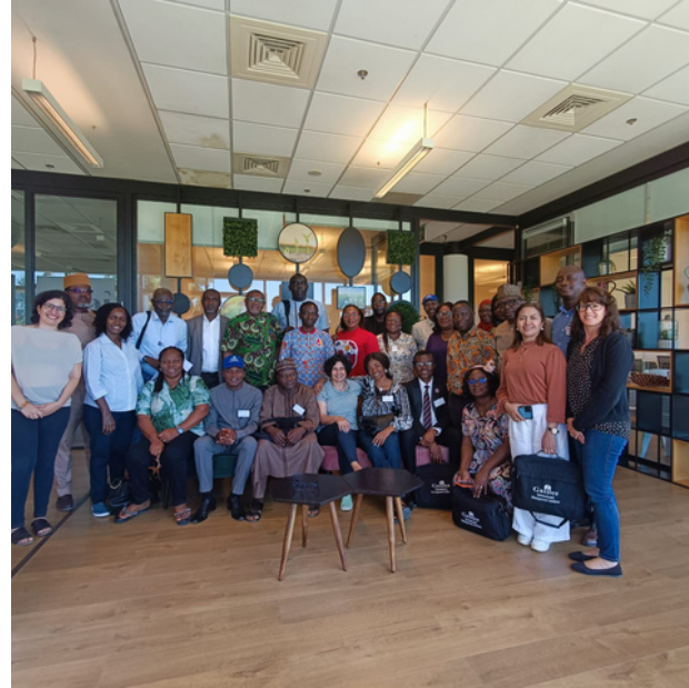
Gestion des Ressources Humaines