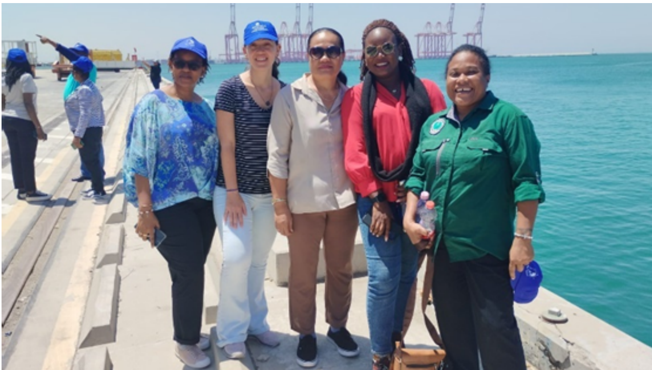
Voyage d'étude au port de Haïfa

Conformément à l'objectif de développement durable n° 5 des Nations Unies visant à lutter contre le déséquilibre entre les sexes, plusieurs candidates travaillant dans le secteur maritime ont reçu une bourse pour participer au programme de formation sur la Gestion Portuaire au Galilee Institute, du 13 au 24 juillet. En savoir plus>>>