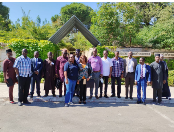
Gestion des Etablissements d'Enseignement Supérieur – En Visite au Conseil de l'Education Supérieure

Les participants au programme sur la Gestion de l'Administration Publique ont fait une rencontre fortuite mémorable avec le Premier ministre israélien, M. Benyamin Netanyahu lors de la visite à la Knesset (le Parlement israélien).