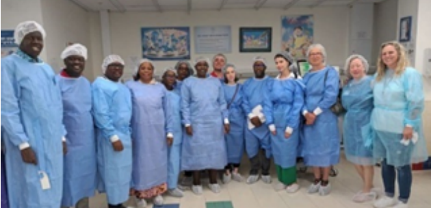
Gestion des Systèmes de Santé